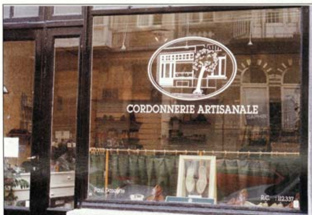
Reconnu par les boutiques à l'enseigne des grands chausseurs.