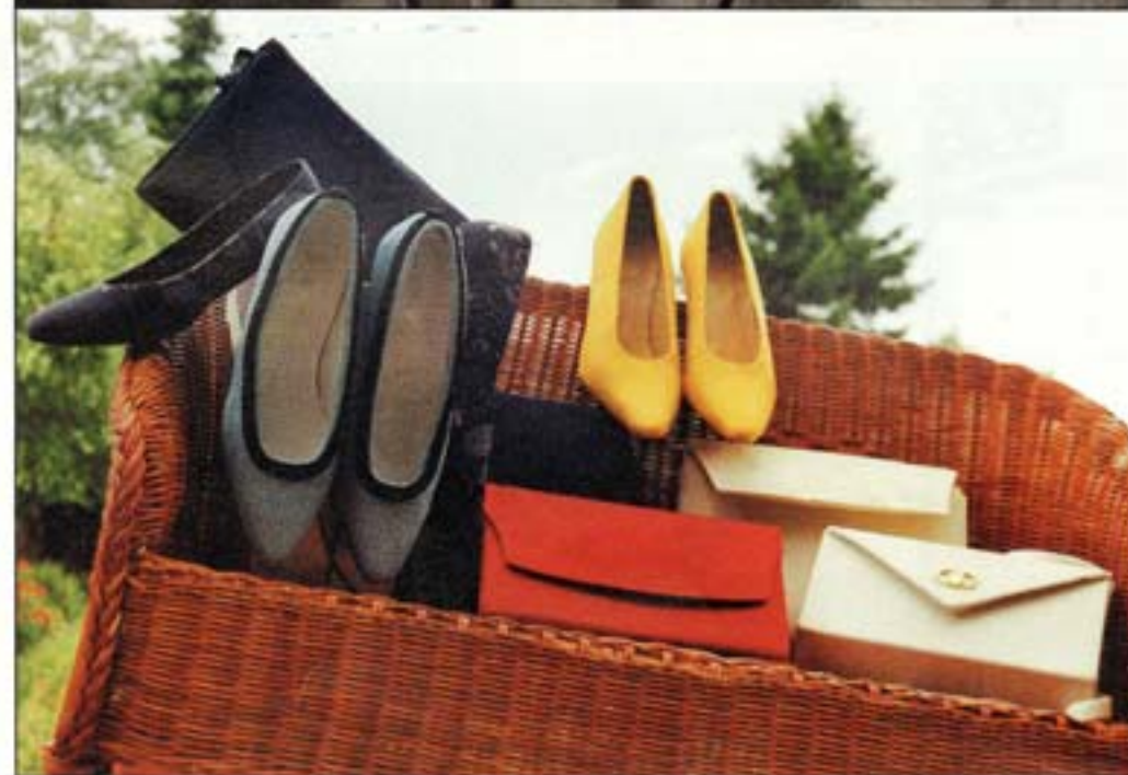
De haut en bas : une collection d'anciennes formes de pieds célèbres. En chaussures, le travail va de glaçage jusqu'à la fabrication sur mesure. Des rêves de particuliers ou de jeunes stylistes de la Cambre ou d'Anvers.

la Cambre ou d'Anvers à exécuter. Tous ces travaux et ces contacts qui lui demandent de quitter la routine et d'imaginer de nouvelles techniques, le passionnent. ■